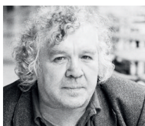
Wolfgang Hilbig

Wolfgang Hilbig war ein Arbeiter-Dichter, ein Wanderer zwischen Deutschland-Ost und Deutschland-West, der sein Leben zwischen den persönlichen und historisch gegebenen Extremen zu bewegender Literatur umzuschreiben vermochte: 1941 in Meuselwitz bei Leipzig geboren, 1985 nach Nürnberg ausgewandert, später in Berlin lebend, wo er 2007 starb, wäre er am 31. August 80 Jahre alt geworden.