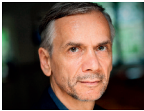
Lutz Seiler

Mittwoch, 10. November 2021, um 19.00 Uhr (Nachholtermin)