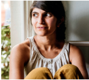
Shida Bazyar © Tabea Treichel

Donnerstag, 21. Oktober 2021, um 19.00 Uhr